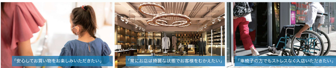
「安心してお買い物をお楽しみいただきたい」